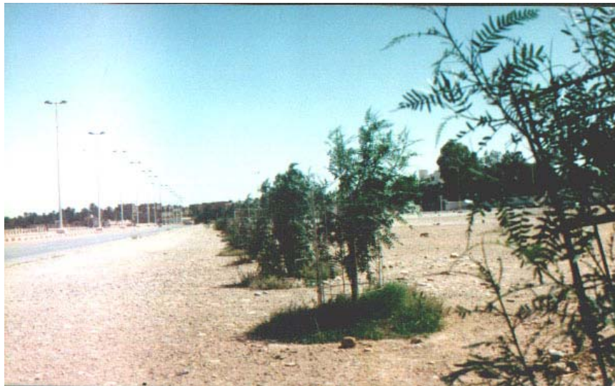
Alignement d'arbres plantés grâce à l'appui technique du CRSTRA le long du Front de l'Oued sud

Le Centre de Recherche Scientifique et Technique des Régions Arides à Biskra, contribuera ce mois de février à la réhabilitation du Jardin Landon, Jardin du 5 juillet et la création de nouveaux espaces verts dans le cadre de la lutte contre la désertification.