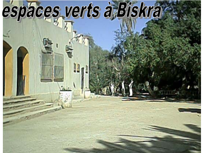
Biskra : Jardin LANDON