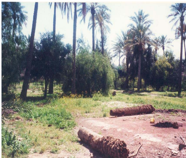
Vue du Jardin LANDON

Le Jardin LANDON : créé en 1872 par le comte Landon, le parc dépend actuellement de l'APC de Biskra. Ce jardin est situé au niveau du quartier appelé « Châtaigner » (Biskra sud-est), il s'étend sur une superficie de 5 hectares entièrement clôturés. Ce jardin, dès sa création était spécialisé dans l'acclimatation des espèces tropicales, subtropicales et méditerranéennes à caractère ornemental et utilitaire. Il se classe juste après le Jardin d'Essai de Hamma (ALGER) avec sa richesse floristique considérable mais a malheureusement subi des dégradations considérables, d'où il se pose aujourd'hui le problème de sa conservation et de sa réhabilitation. Ce jardin nécessite un sérieux aménagement qui lui restituera