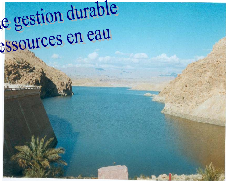
Barrage de Fom el Gherza (wilaya de Biskra)

Pour une gestion durable des ressources en eau