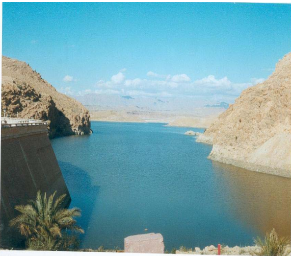
Barrage de Foug el Gherza (wilaya de Biskra)

L'actualité en Algérie est le problème de l'eau. Des mesures d'urgence ont été prises pour assurer un service minimum. Le programme de citernage et de la réalisation de forages qui sont, des mesures conjoncturelles nécessaires, mais qui ne peuvent, à elles seules, résoudre la crise de l'eau. Les walis et le gouvernement tente de sensibiliser la