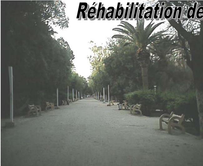
Biskra : Jardin 05 juillet 1962