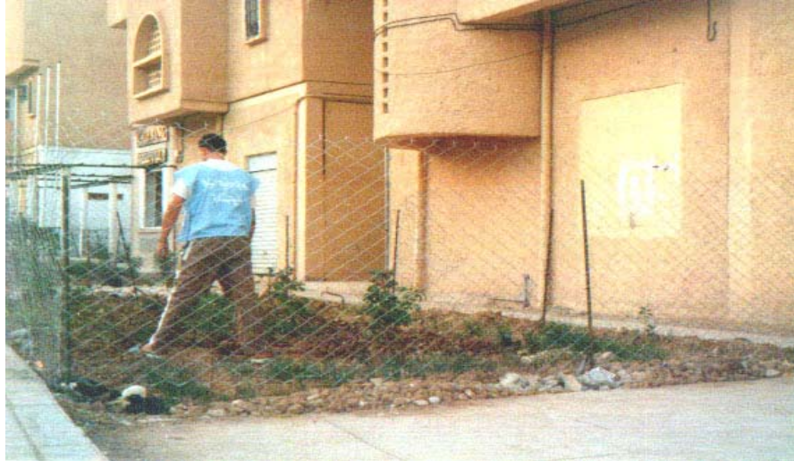
Espaces verts créés dans des quartiers de Biskra